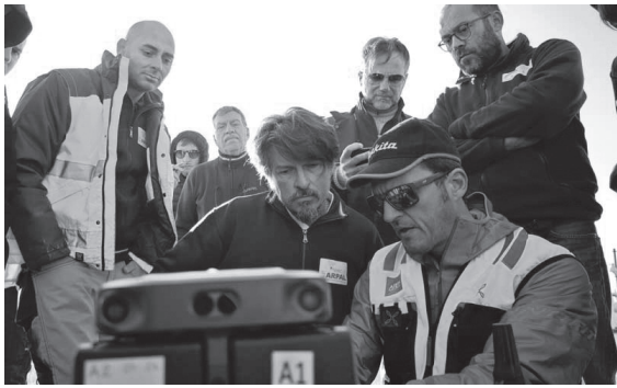
Nelle foto: Un momento dell'esibizione e il Sentinel II.

BOLOGNA – Il monitoraggio sia ambientale che di sicurezza sta utilizzando sempre di più i droni, le ultime generazioni dei quali sono ormai ad altissima affidabilità. Nei giorni scorsi in diverse località dell'Emilia-Romagna si è svolta un'esercitazione congiunta con i vari nuclei droni di Ispra e delle Agenzie ambientali, per rendere più efficace il monitoraggio attraverso l'uso di tecniche di osservazione del terreno da remoto. L'impiego di Unmanned Aircraft Systems (UAS – Sistemi aeromobili a pilotaggio remoto) è una realtà già diffusa nell'ambito del Sistema nazionale per la protezione dell'ambiente, tuttavia si punta a una crescente omogeneizzazione delle procedure operative con l'obiettivo di definire uno standard comune Snpa, cioè dei protocolli metodologici condivisi a livello nazionale per l'uso di queste tecnologie nell'ambito dei controlli ambientali. Da sottolineare le difficoltà che ancora ci sono dai protocolli - in parte obsoleti - dell'ENAC che sembrano particolarmente ostici per il monitoraggio e l'utilizzo dei droni in ambito marittimo.