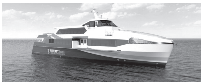
Nella immagine: Il rendering del traghetto veloce “Vittorio Morace”.

HOBART - In tempi di rinnovo delle navi traghetto per numerose compagnie europee, il cantiere spagnolo Armon di Vigo è ormai pronto a varare nei prossimi giorni il primo di una serie di almeno 9 o 12 traghetti veloci commissionati da Liberty Lines.