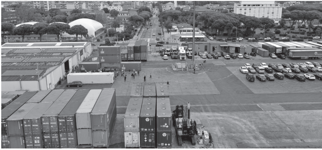
Nella foto: L'area Grendi che ospiterà il simpatico convivio.

MARINA DI CARRARA – Questa volta il maltempo non ci sta mettendo - si spera - lo zampino. E la simpatia cerimonia dell'incontro culinario con il caratteristico piatto del “porceddu” sardo - rinviata due settimane