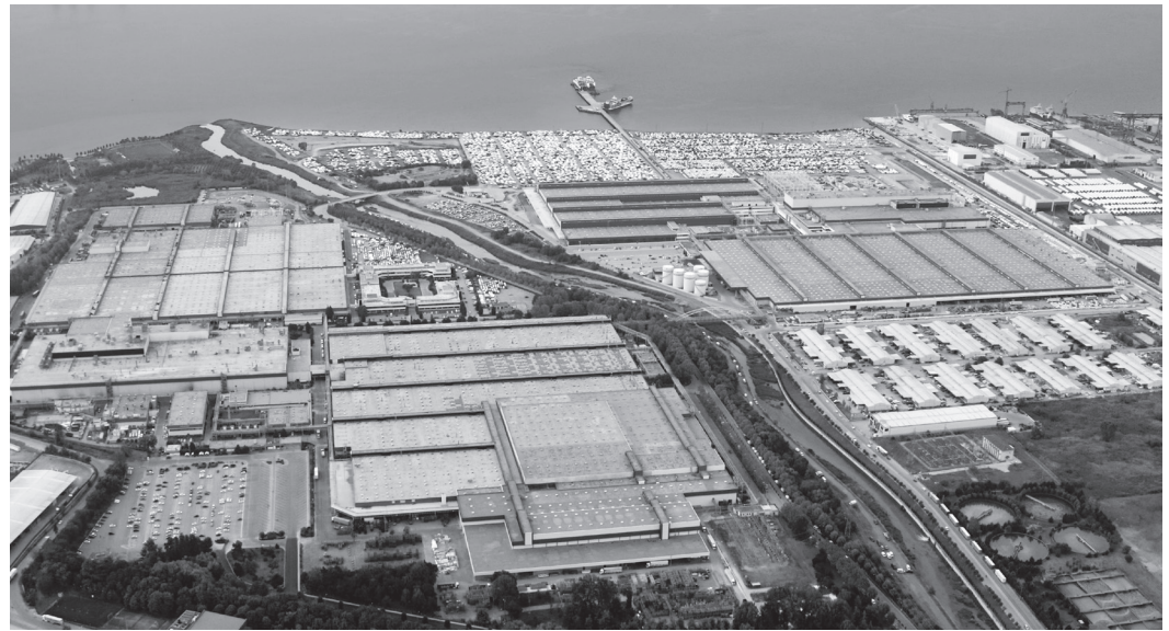
Nella foto: L'area dello stabilimento Ford in Turchia.

KOCAELI – Ford Otosan celebra il nuovo corso del suo stabilimento di Yeniköy, in Turchia, completamente rinnovato e dedicato alla produzione della nuova generazione del Ford Transit Custom, aumentando la produttività per i veicoli commerciali Ford Pro in tutta Europa.