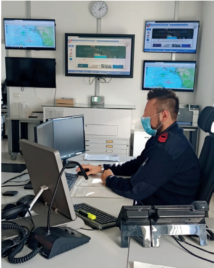
Nella foto: Un operatore della Guardia Costiera di Livorno, impegnato nei controlli dei sistemi di monitoraggio della pesca.

Nell'area di Montecristo aveva usato strumenti vietati e spento il sistema satellitare di tracciamento