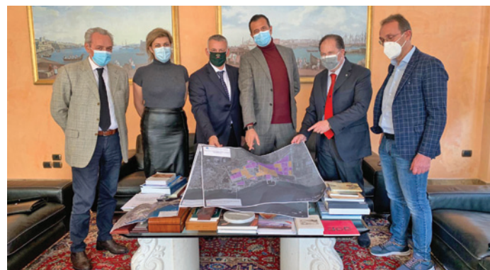
Nella foto: Un momento dell'incontro.

L'importazione della bentonite in primo piano tra i programmi di crescita