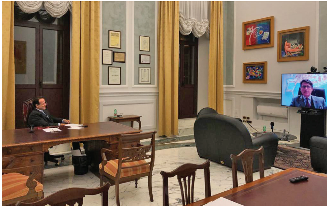
Nella foto: Un momento dell'accordo.

La velocizzazione delle procedure tra i punti più importanti da raggiungere