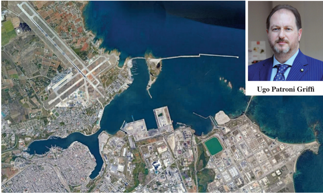
Ugo Patroni Griffi

Firmato atto per la redazione dello strumento strategico e di programmazione per lo scalo pugliese