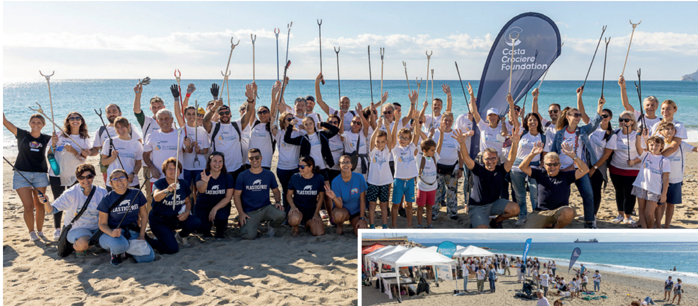
Nelle foto: Due momenti dell'iniziativa a Savona.

GENOVA – In occasione del World Cleanup Day, l'appuntamento annuale che unisce 191 paesi in tutto il mondo per un pianeta più pulito, Costa Crociere Foundation ha organizzato a Savona il "Guardiani della Costa for World Cleanup Day", un'iniziativa di sensibilizzazione alla salvaguardia ambientale che ha avuto l'obiettivo di lanciare la nuova edizione di "Guardiani della Costa", il progetto nazionale di educazione ambientale e citizen science promosso dalla fondazione. Circa 150 persone, tra cui studenti