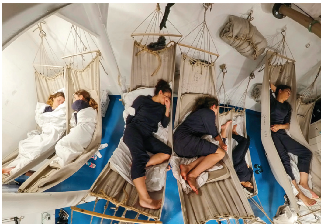
Nelle foto: Due aspetti della vita di bordo.

LIVORNO – Oggi, sabato 24 settembre, ore 18, al Museo della Città di Livorno si tiene un incontro dedicato al prestigioso equipaggio