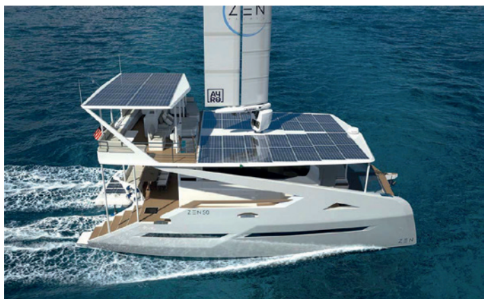
Nell'immagine: Il rendering di ZEN 50.

BARCELONA – Nel 2023 sarà varato in Spagna lo Zen 50, catamarano a vela voluto da una società francese in collaborazione con la Ayro, una spin off della VPLP, il più famoso studio di progettazione di catamarani sportivi al mondo. Lo riferisce il sito SVNetwork che fornisce anche altre interessanti