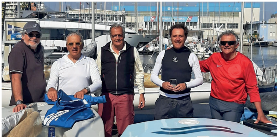
Nella foto: Un momento della premiazione.

VIAREGGIO – Si è conclusa con successo la prima delle due tappe del Campionato d'Autunno 2022, la manifestazione riservata alle classi Star e Finn, ben organiz-