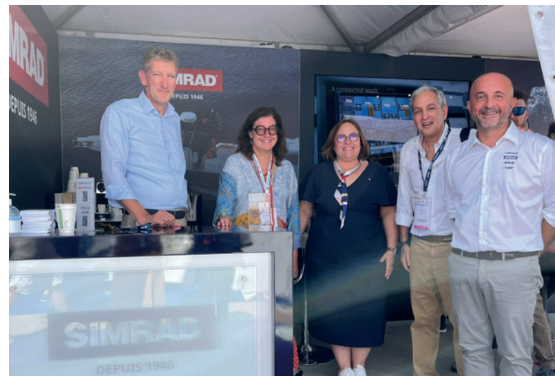
Nella foto: La presentazione.

CANNES – Ha fatto sensazione al recente Festival nautico l'assegnazione del prestigioso riconoscimento ricevuto per il "Green Assistant" di Simrad al Monaco Energy Boat Challenge.