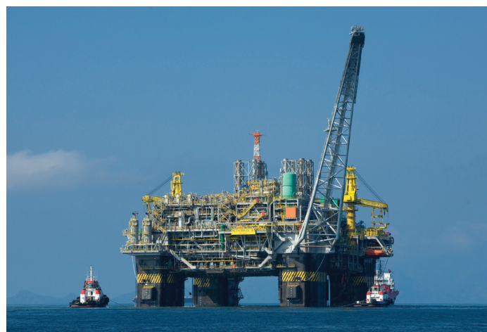
Nella foto: Una piattaforma marina davanti alla costa ravennate.

Un prolungamento del blocco delle attività di ricerca sta facendo chiudere le aziende e licenziare migliaia di persone - Gli incontri romani