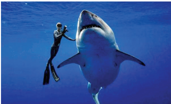
Nella foto: Un'impressionante immagine sub di "game" fotografico con uno squalo bianco.

Presentate anche imbarcazioni specializzate e i loro più attuali allestimenti - Le attività subacquee e il turismo