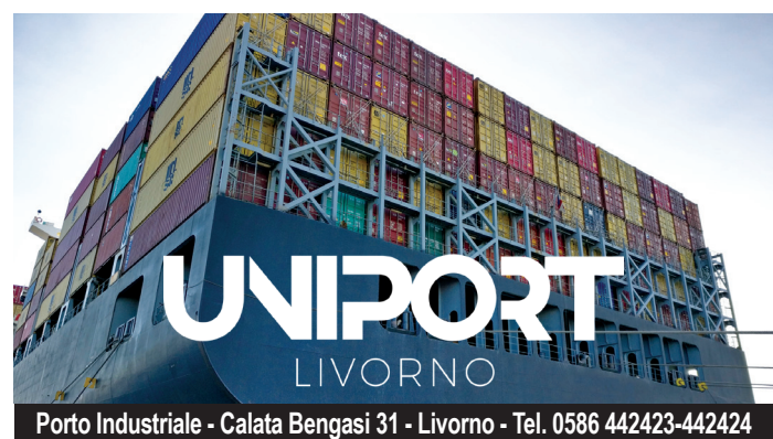
Porto Industriale - Calata Bengasi 31 - Livorno - Tel. 0586 442423-442424

Il commissario straordinario per (segue in ultima pagina)