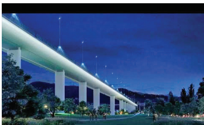
Nella foto: Il rendering del nuovo viadotto in costruzione alla periferia di Genova.