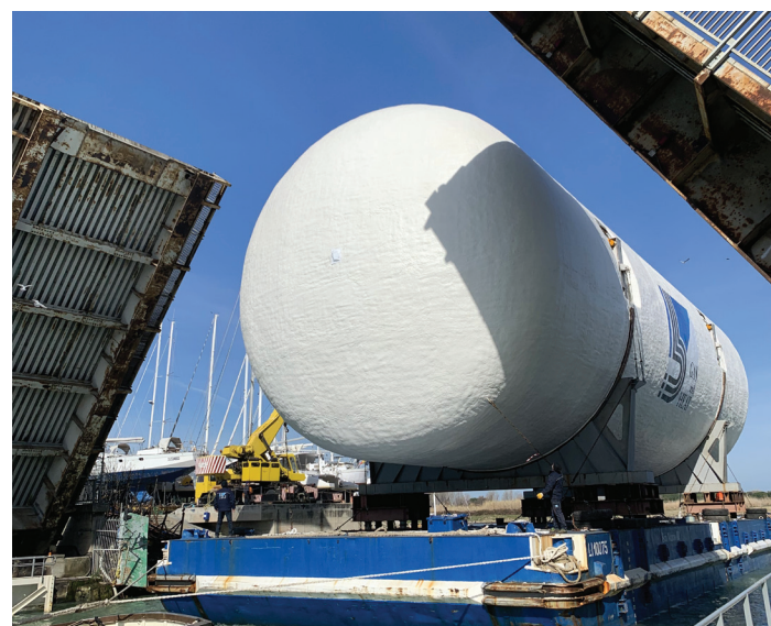
Nella foto: Il passaggio di uno dei serbatoi dalle porte vinciane.

LIVORNO - Nel terminal Lorenzini & C. in Darsena Toscana è stato completato da pochi giorni l'imbarco di due imponenti serbatoi di carburante progettati e realizzati da Gas and Heat, prestigiosa azienda del settore, che ha scelto la partnership con il terminalista livornese. I due tank, che andranno a formare il sistema di carico e contenimento di carburante a GNL di navi in costruzione a Singapore, hanno un peso superiore alle 350 tonnellate ciascuno e 40 metri di lunghezza. Trasportati via chiatra fino al terminal, hanno attraversato il canale dei Navicelli e oltrepassato le porte vinciane che permettono l'accesso alla Darsena grazie ad una operazione di logistica integrata e alla collaborazione continua tra tutti i player coinvolti. Le fasi di imbarco sono durate tre (segue in ultima pagina)