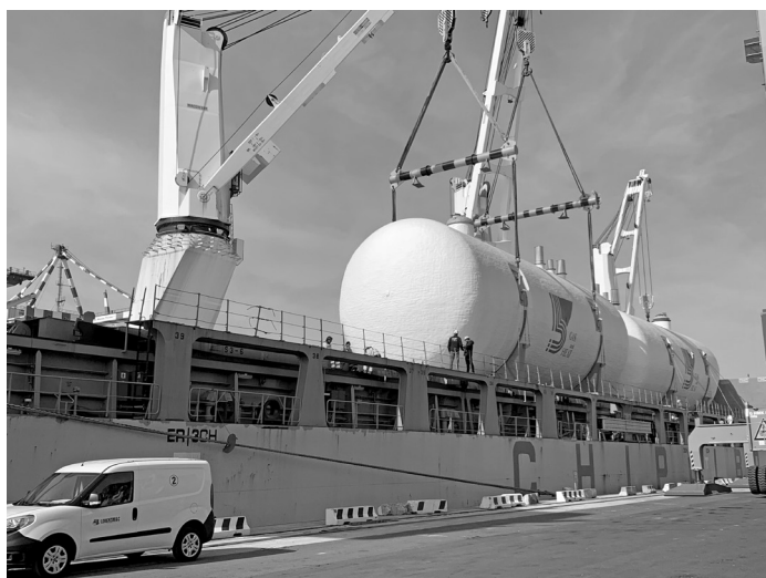
Nella foto: L'imbarco al terminal Lorenzini dei due maxi-serbatoi.

giorni, supervisionate continuamente dal personale del Terminal. Il rizzaggio e la stabilizzazione del carico hanno richiesto grande professionalità e lavorazioni anche in quota, svolte nel totale rispetto delle normative sulla sicurezza del lavoro.