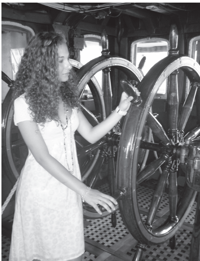
Nella foto: Immagine simbolica, una donna che guida una grande nave.

Secondo ConvezioniIstituzioni, la prima piattaforma sui dipendenti pubblici, il 56.6% degli impiegati è donna. In 12 settori su 22 la presenza femminile supera quella maschile