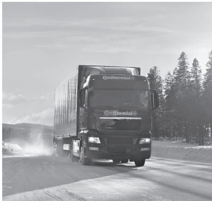
Nella foto: Nel 2018 in Italia le immatricolazioni di veicoli pesanti (e cioè con PTT - peso totale a terra - superiore a 16 tonnellate) per il trasporto merci sono state 28.277, con un aumento del 18,8% rispetto al 2017. Questi dati emergono da un'elaborazione del Centro Ricerche Continental Autocarro su dati Aci.

delle immatricolazioni nel 2018 rispetto al 2017. A guidare la graduatoria è ancora una volta la Valle d'Aosta (+371,4%), seguita da Puglia (+92,9%) e Trentino Alto Adige (+50,4%). Positivi anche i dati di Calabria (+49,4%), Lombardia (+34,3%) e Veneto (+12%). Tutte le altre regioni hanno fatto registrare dati in calo.