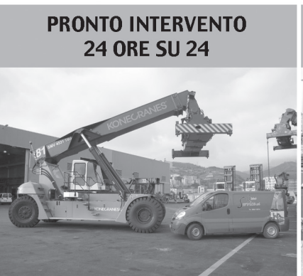
PRONTO INTERVENTO 24 ORE SU 24