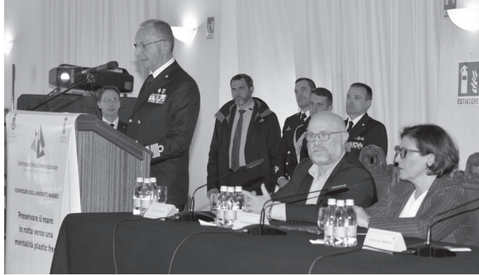
Nella foto (da sx): L'ammiraglio Valter Girardelli, il sindaco Filippo Nogarini e il ministro della difesa Elisabetta Trenta.

Tutti i vincitori delle classi e la partecipazione delle imbarcazioni storiche e di Nave Italia