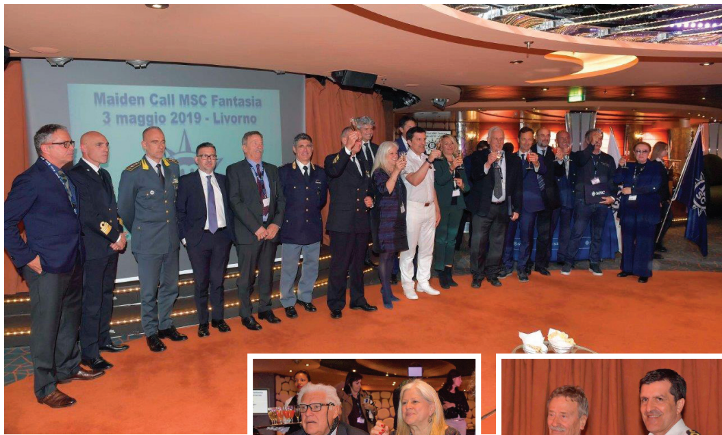
Nella foto: Il brindisi con i vip.